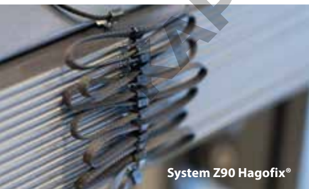
System Z90 Hagofix®

Színek a SELT palettában 140-141. oldalon